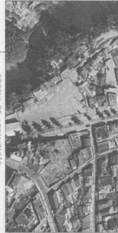
CRUQUE DE LOCALIZAÇÃO Projeto de Eventos - Bairro Centro Soledade de Minas - MG SEM ESCALA - UNIDADE: m